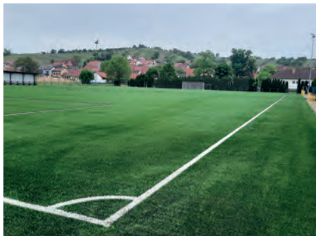
Nová umělá tráva

Dařilo se i B-mužstvu mladších žáků, kteří v okresním přeboru obsadili krásné 2. místo. Pozitivní je, že za něj hráli už převážně kluci, kteří mohou hrát za mladší žáky i v příští sezóně, včetně kluků