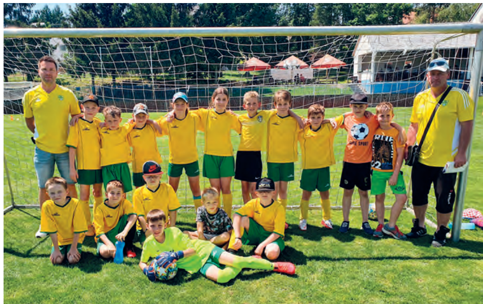
Starší příprava FK Mutěnice

Mladší žáci si vedli ve své soutěži velmi slušně, byť rozhodující zápas o 3. místo v Dubňanech s Rajhradem v posledním kole těsně prohráli. Ročník 2009 je po spojení velmi silný a měl by do budoucna produkovat šikovně hráče do Mutěnic, Dubňan i Svatobořic.