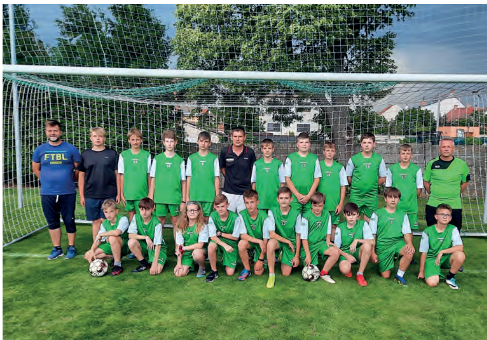
Mladší žáci Dubňany/Mutěnice