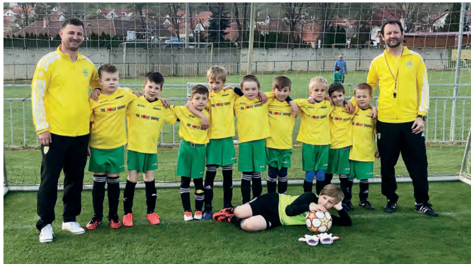
Mladší přípravka FK Mutěnice