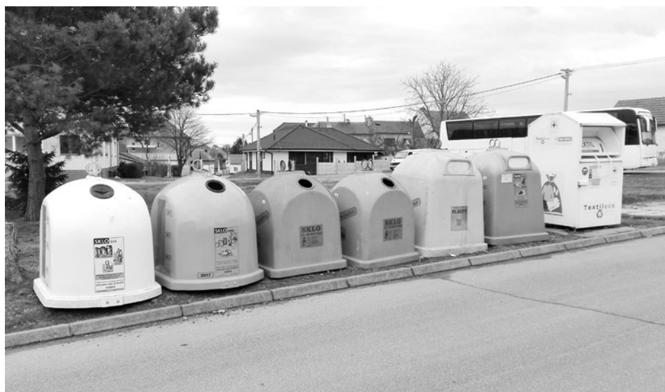
Sběrné místo odpadů na Gencmorku