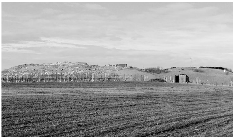
Trochu jiný pohled na skládku

Zásadní projektem letošního roku je rozšíření skládky o část lokality mezi skládkou a kompostárnou. Tímto navýšením bychom měli mít zajištěné ukládání odpadu a tím i pořad velmi slušný příjem do obecní pokladny až do r. 2022. V současnosti leží na Krajském úřadě naše žádost o změnu integrovaného povolení. Pokud nenastanou nějaké nečekané komplikace, měli bychom vše stihnout ještě do konce letošního roku. V poslední tabulce je uveden přehled odpadů převzatých v minulých třech letech na jednotlivých provozech společnosti. Z ní lze lehce vyčíst, že ne všečen odpad končí ve skládce. A to je určitě dobře!