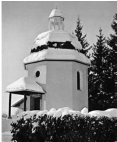
Kaple Tiché noci postavená na místě zbořeného kostela sv. Mikuláše v rakouském Oberndorfu (Salzburg).

Koleda Stille Nacht, Heilige Nacht se narodila o Vánocích roku 1818. Vznikla naprostou náhodou. Původně byl její text zamýšlen pro báseň. Tu, šestislokovou, složil pomocný kněz P. Joseph Mohr (narozen 11. 12. 1792 v Salzburgu, zemřel 4. 12. 1848 ve Wagrainu).