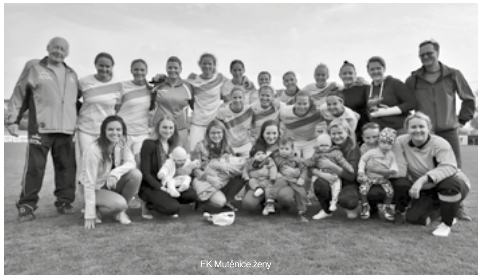
FK Mutěnice ženy